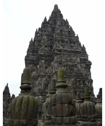
ラーマーヤナのレリーフ